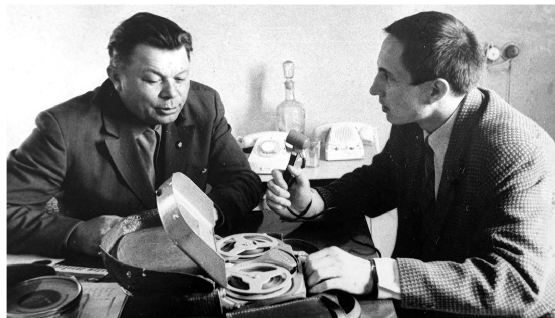
Интервью с партгором совхоза «Шортандинский», Акмолинский район, Казахстан. 1973 год