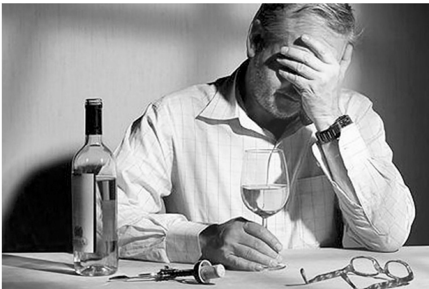
Причин, по которым человек тянется к алкоголю, множество, а итог один — поломанная жизнь

Существуют разные мотивы и причины, по которым люди начинают употреблять алкоголь. Например, прием алкоголя связан с жаждой удовольствия, или же человек пьет чтобы снять состояние эмоционального напряжения, тревоги, беспокойства, неуверенности. Нередко прием алкоголя связан с повышенной поднимемостью, неспособностью противостоять окружению. Еще одна причина — алкоголь употребляется в качестве допинга, для того чтобы поднять тонус, повысить активность и улучшить работоспособность. Такие паци-