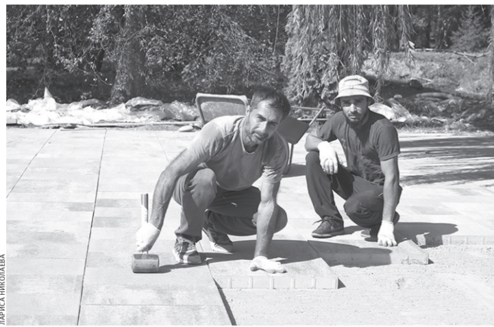
В парке идет укладка новой плитки

— Почти на 90 % это стихия, хотя не обходится и без стрельбы по светильникам из рогаток,